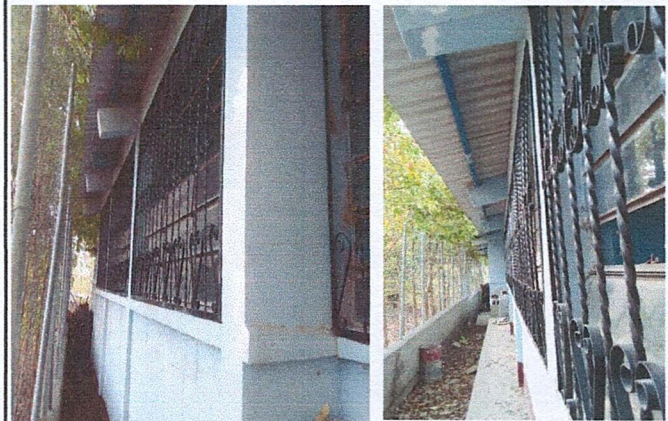
Foto 4: Área donde se esta instalando los balcones lado lateral aulas 1, 2 y 3.

Observación: Si es necesario se pueden agregar hojas adicionales y actualizar el número de hojas.