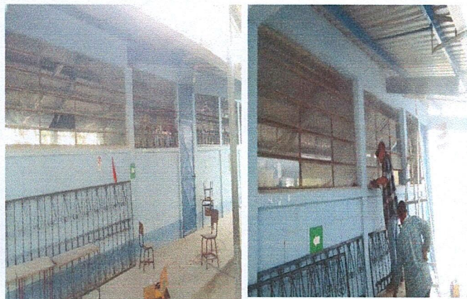
Foto 3: Área donde se esta instalando los balcones para los ventanales frontal aula 1, 2 y 3.